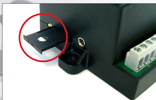
Detalle de ranura para inserción de tarjeta SIM

El modelo CCGSM11 tiene una salida preparada para activar la calefacción con o sin termostato externo y una entrada para recibir avisos desde un sensor (interruptor de puerta, sensor inundación...).